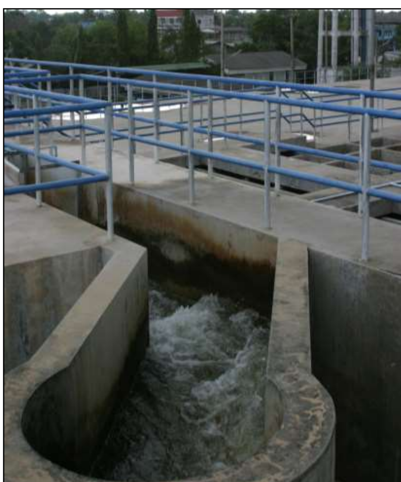
Figure 1 – Comment insérer une image

Les images sont utilisées pour montrer les points clés de la recherche. Vous devez les utiliser mais éviter une résolution excessive, supérieure à 150 dpi mais inférieure à 300 dpi. Enregistrez les photos au format .jpg ou png (les graphiques au format png) et tenez compte du fait que les images web sont généralement de faible résolution. Si l'image n'est pas la vôtre, mentionnez-en la propriété intellectuelle.